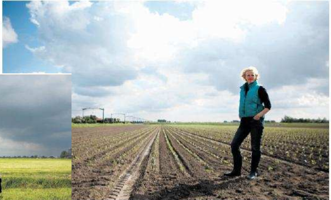
en, Noord-Brabant, en voorzitter van de Nederlandse Akkerbouw Vakbond.

maal wel in een gesloten markt met productiequota en één organisatie die alle melk verhandelt. In een beheerscomité onderhandelen boeren over de prijs met melkfabrieken, supermarkten en de overheid die toezicht houdt op misbruik. Via monitoring van een geselecteerde groep boeren berekenen ze de gemiddelde kostprijs voor een liter melk. Melk mag niet