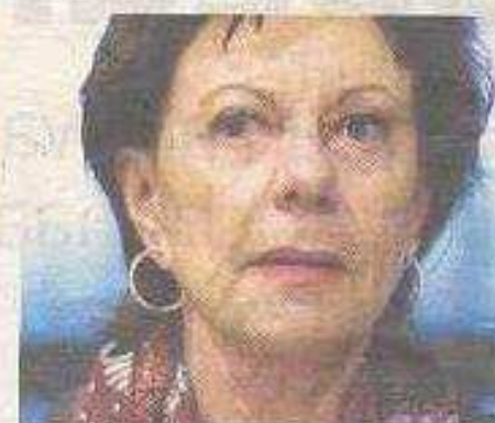
Euro-commissaris Neelie Kroes.